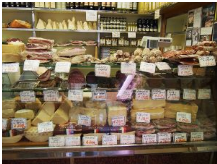
Un negozio di alimentari a Roma, 2018.