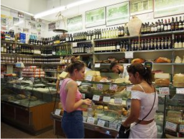
A Roma, estate 2018.