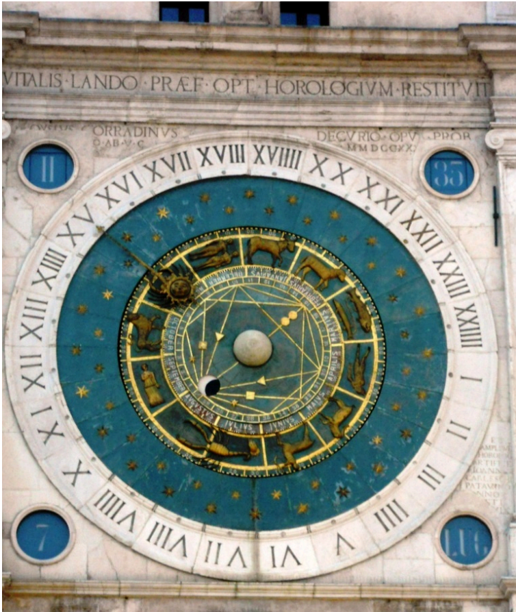
L'orologio astronomico di Padova (1436).

Clicca l'immagine seguente per accedere al file pdf :