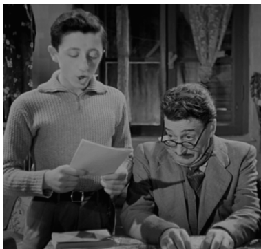
Lattore comico Totò in “Guardie e ladri” (1951).